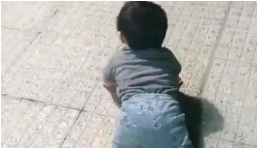
Osteopatía de avanzada clínica cpo especialidades médicas videos