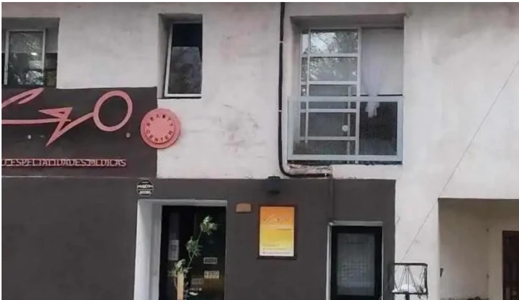
Osteopatía de avanzada clínica cpo especialidades médicas villa mercedes