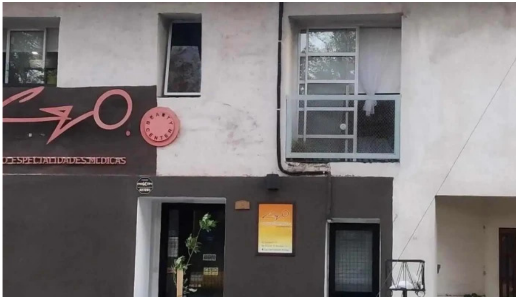
Osteopatía de avanzada clínica cpo especialidades médicas horario