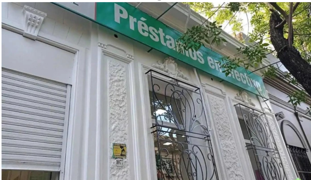
Credil srl suc solis cdad autonoma de buenos aires