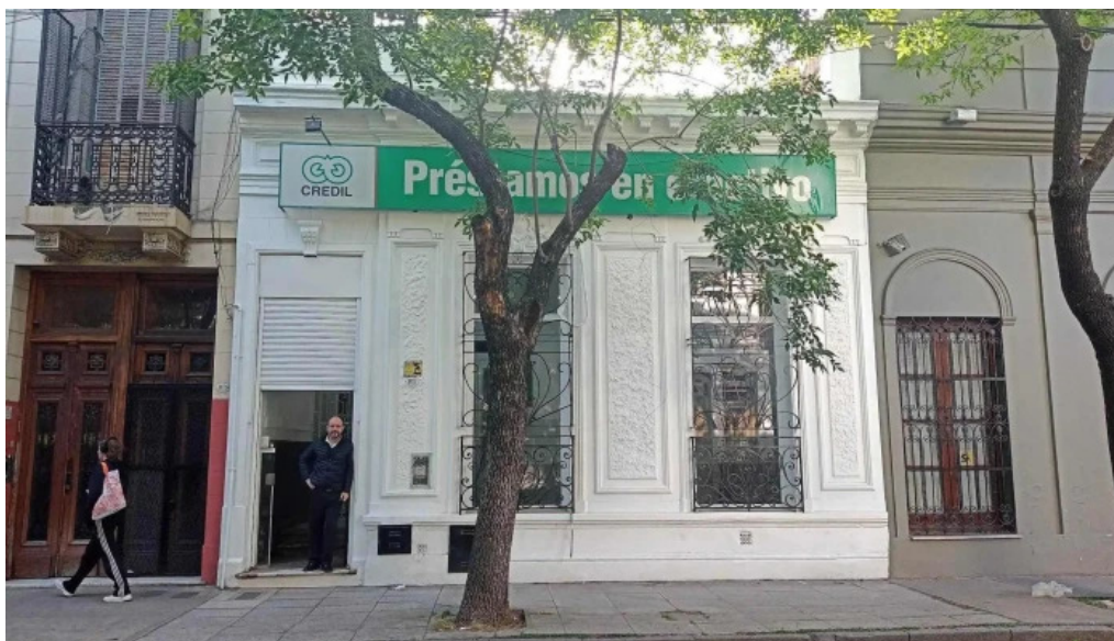
Credil srl suc solis del propietario