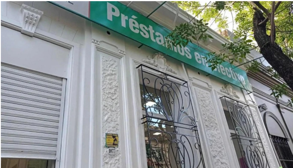
Credil srl suc solis telefono