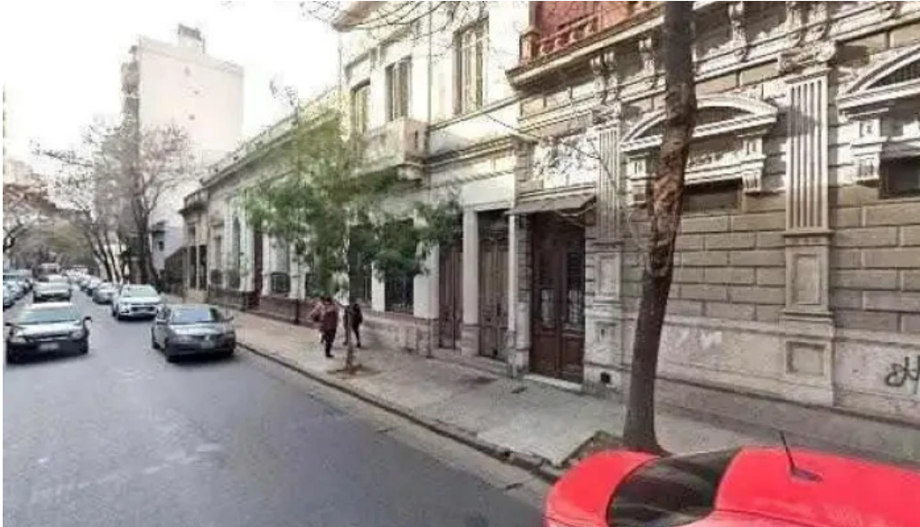
Credil srl suc solis telefonodeg