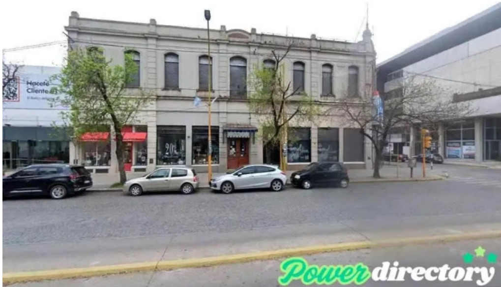
Circulo kinesiologos y fisioterapeutas san francisco