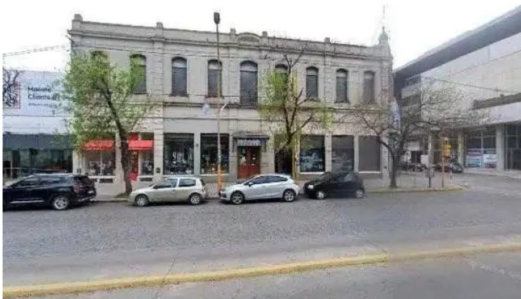
Circulo kinesiologos y fisioterapeutas catalogo