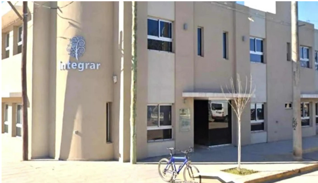
Integrar marcos juarez