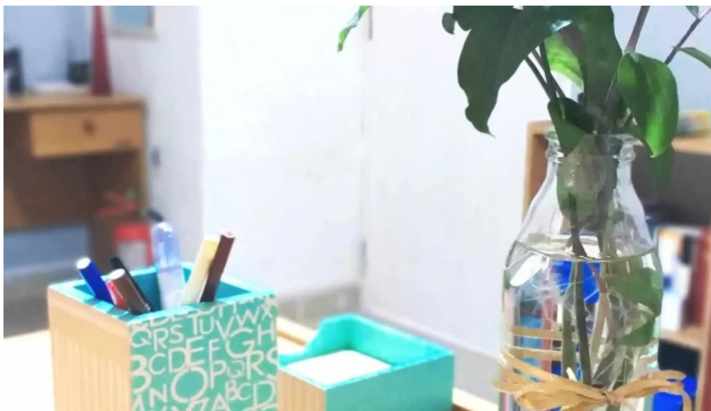
Traslasierra salud descuentos