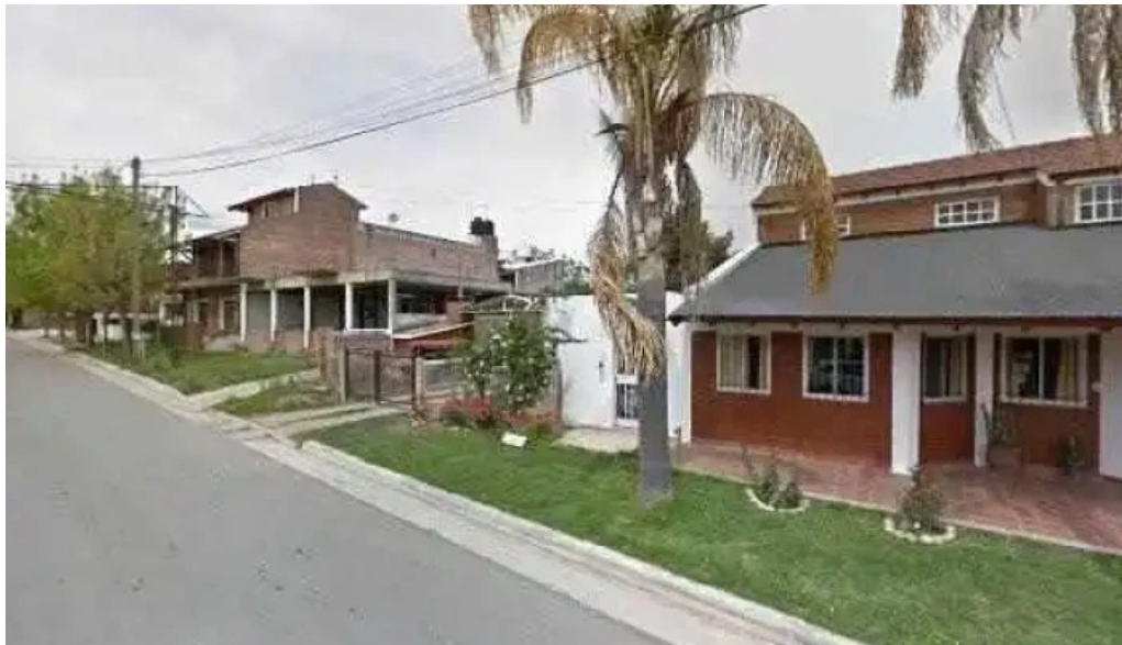
Traslasierra salud descuentosdeg