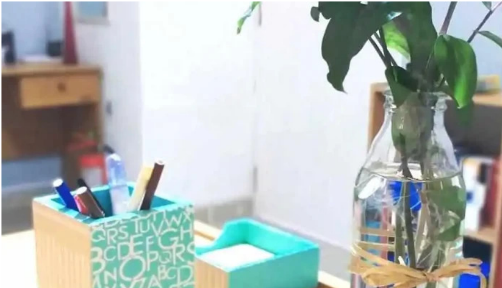
Traslasierra salud mina clavero