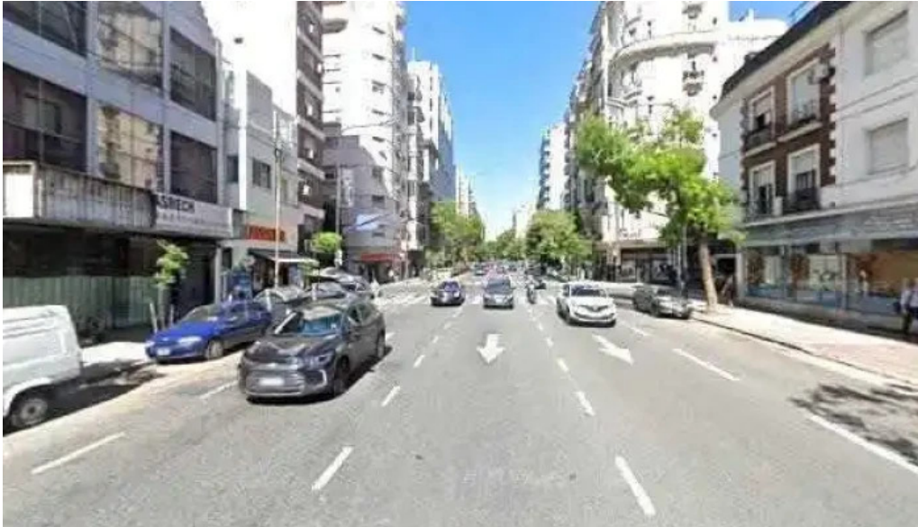
Loan business zona