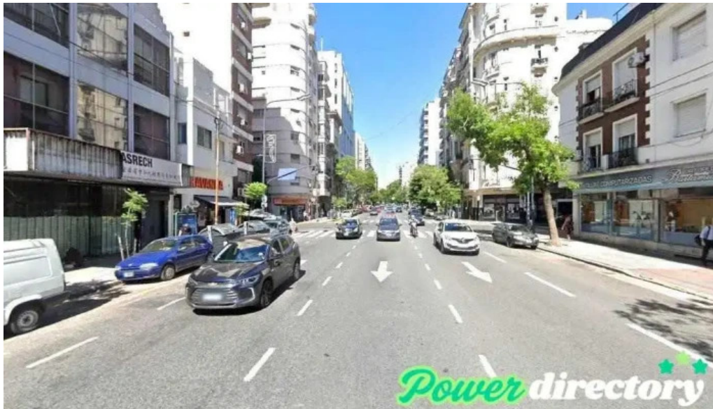
Loan business cdad autonoma de buenos aires